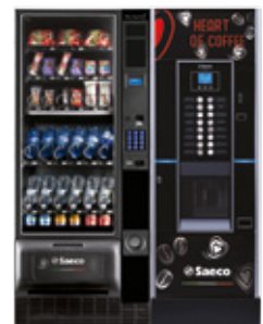
Artico S + Cristallo Evo 400